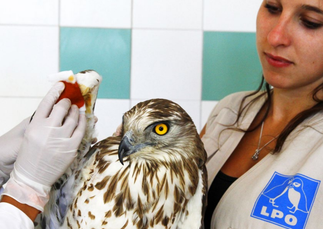
Circaète Jean-le-Blanc en soins